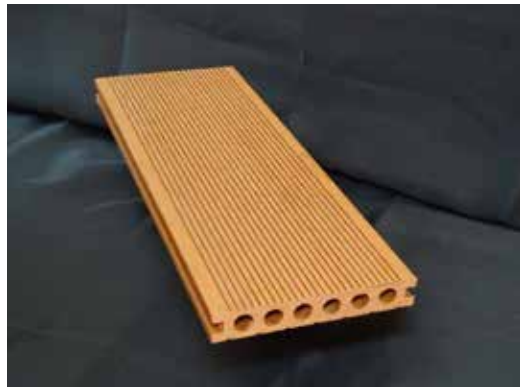
Arkodeck ranurado tipo O